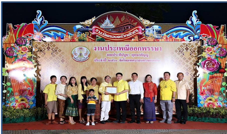
ภาพกิจกรรมที่ 3 พิธีมอบรางวัลครอบครัวดี