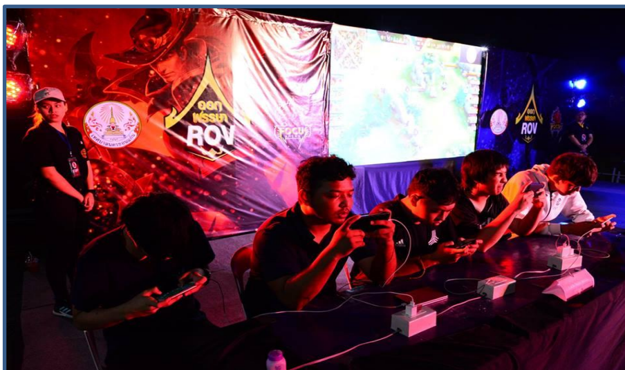
ภาพกิจกรรมที่ 11 การแข่งขัน E- Sport (ROV)