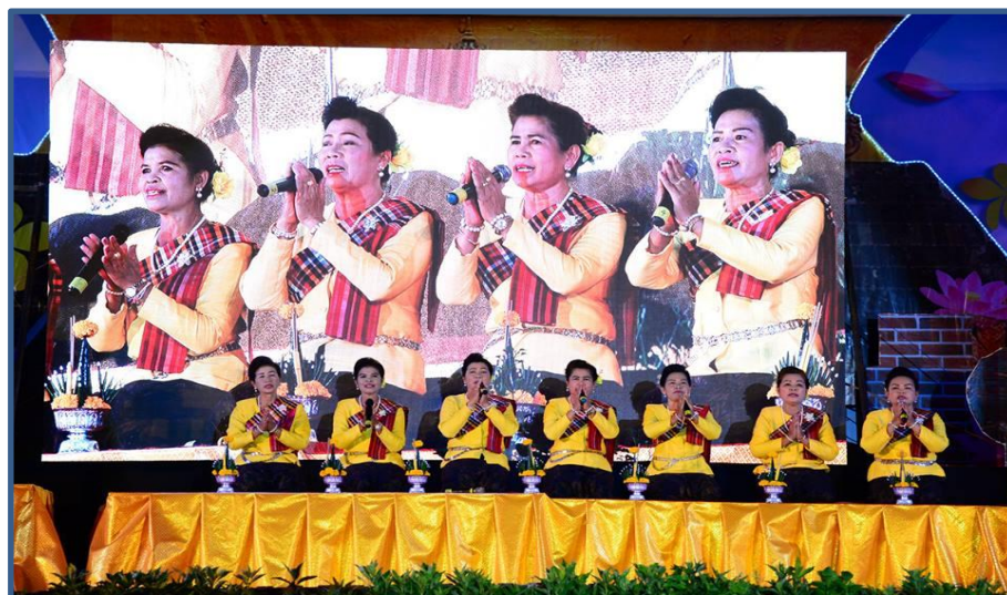
ภาพกิจกรรมที่ 10 การประกวดสวดสรภัญญะ