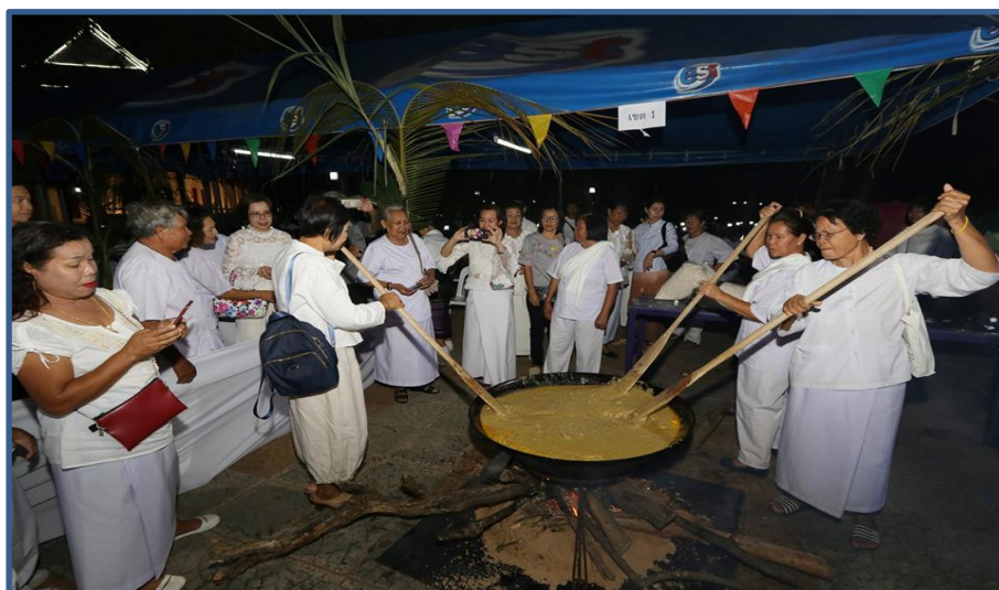
ภาพกิจกรรมที่ 14 พิธีทวงข้าวทิพย์ไทย