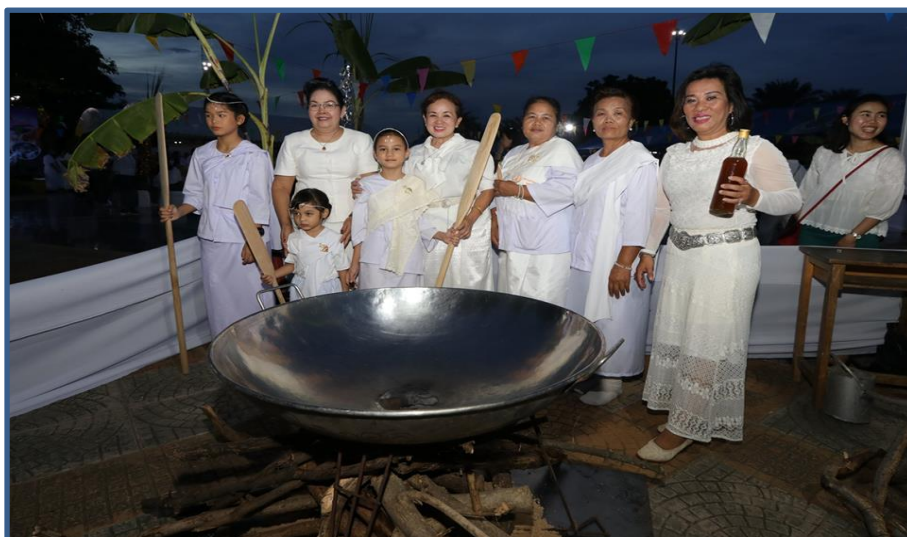
ภาพกิจกรรมที่ 14 พิธีกวนข้าวทิพย์ไทย