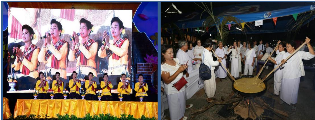
ฝ่ายแผนงานและประเมินผล กองวิชาการและแผนงาน เทศบาลนครขอนแก่น