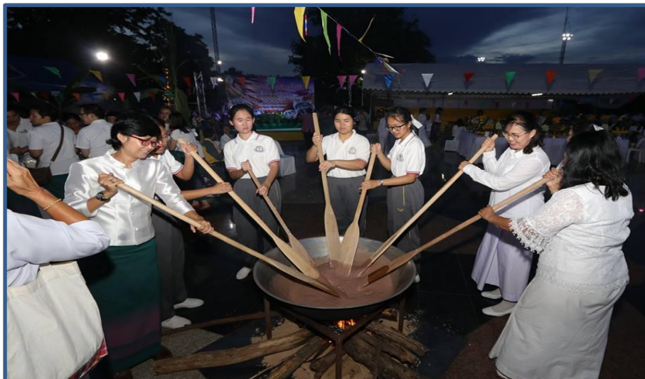
ภาพกิจกรรมที่ 14 พิธีกวนข้าวทิพย์ไทย