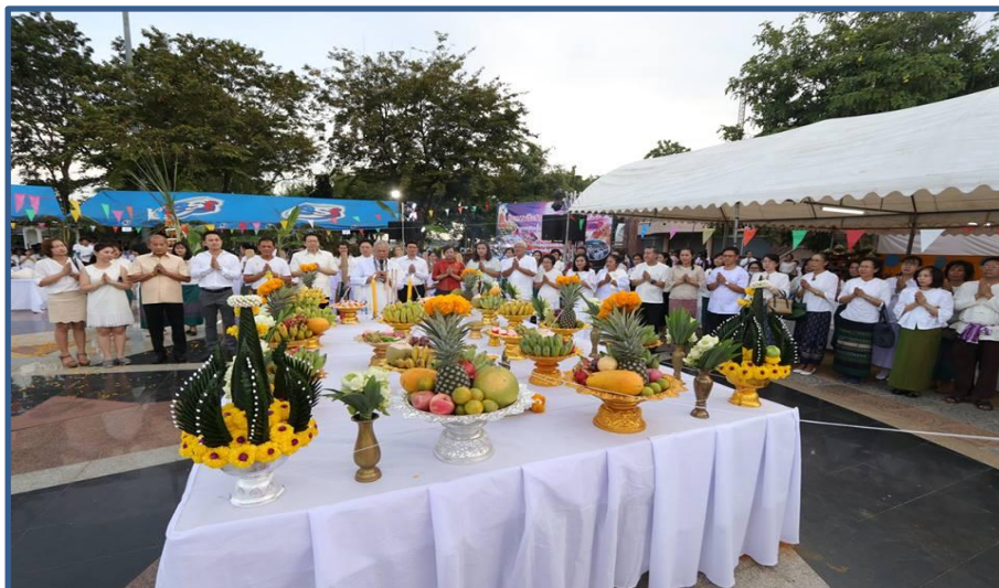
ภาพกิจกรรมที่ 13 พิธีทวงข้าวทิพย์ไทย