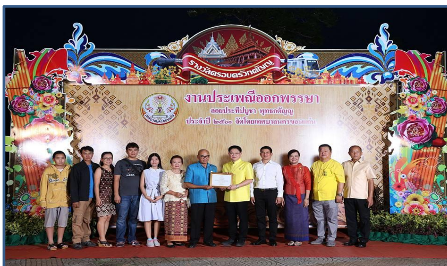
ภาพกิจกรรมที่ 4 พิธีมอบรางวัลครอบครัวดี