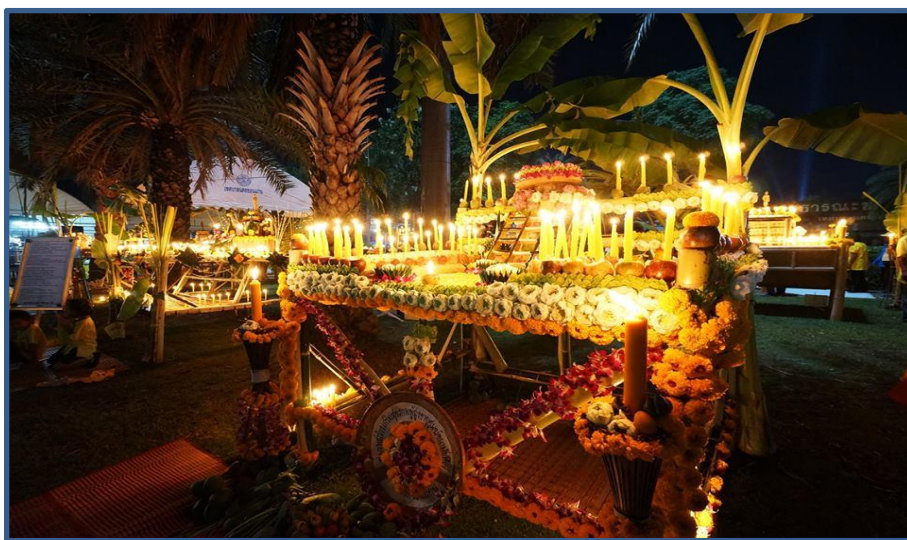
ภาพกิจกรรมที่ 6 การประกวดฮ้านประทีป