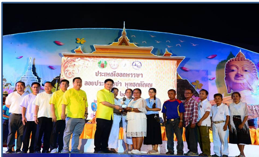
ภาพกิจกรรมที่ 1 พิธีมอบรางวัลการประกวดฮ้านประทีป