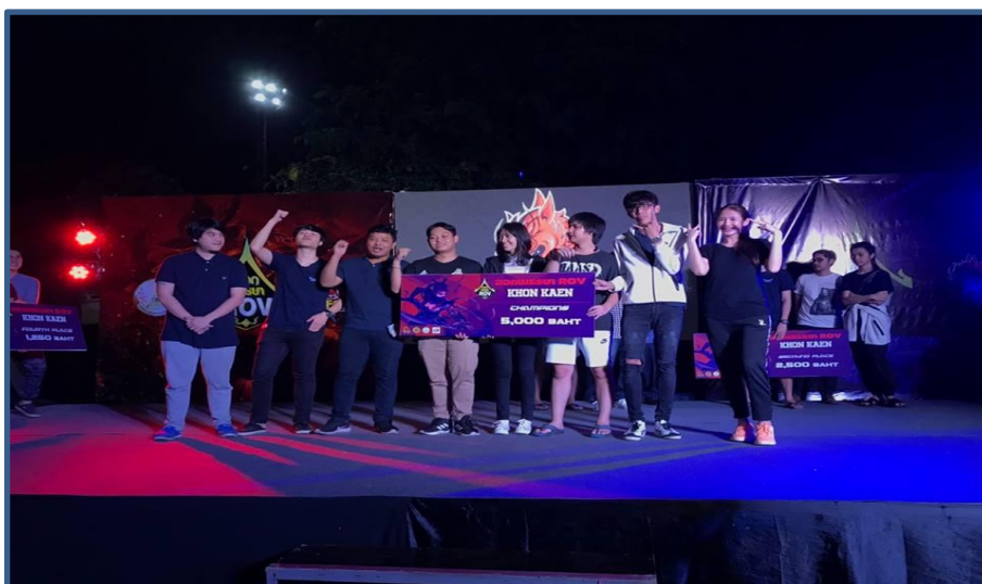
ภาพกิจกรรมที่ 12 การแข่งขัน E- Sport (ROV)