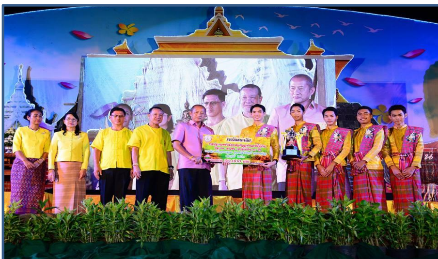
ภาพกิจกรรมที่ 9 พิธีมอบรางวัลการประกวดสวดสรภัญญะ