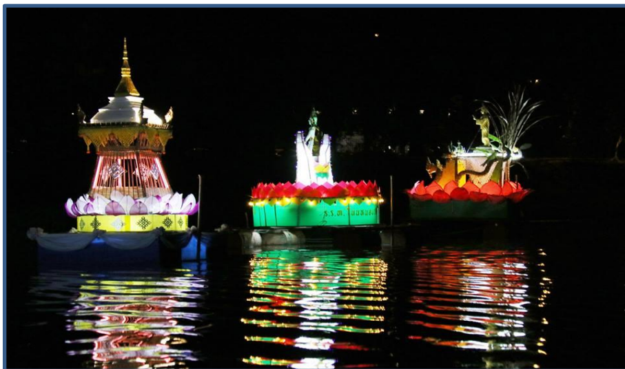
ภาพกิจกรรมที่ 7 พิธีลอยประทีปบูชาน้ำ