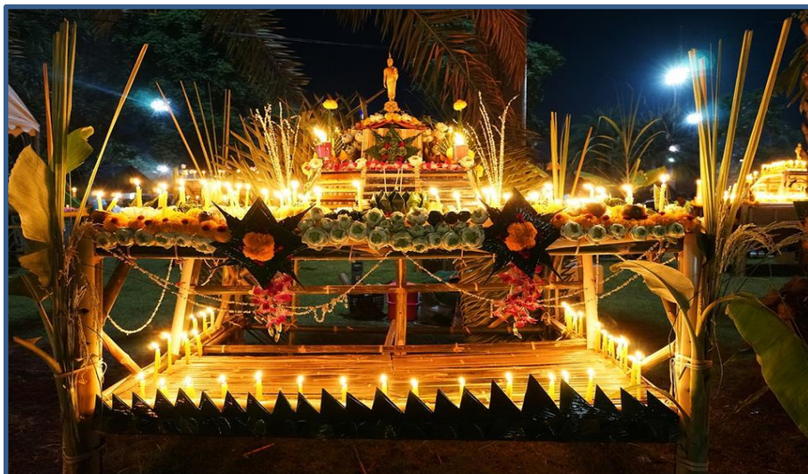
ภาพกิจกรรมที่ 5 การประกวดฮ้านประทีป