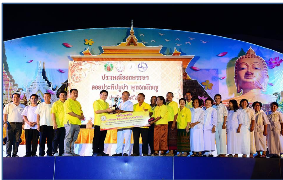
ภาพกิจกรรมที่ 2 พิธีมอบรางวัลการประกวดฮ้านประทีป