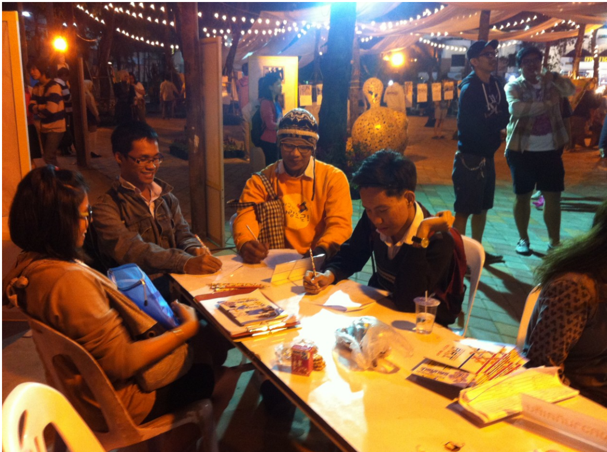
ภาพตัวอย่างการเก็บข้อมูล