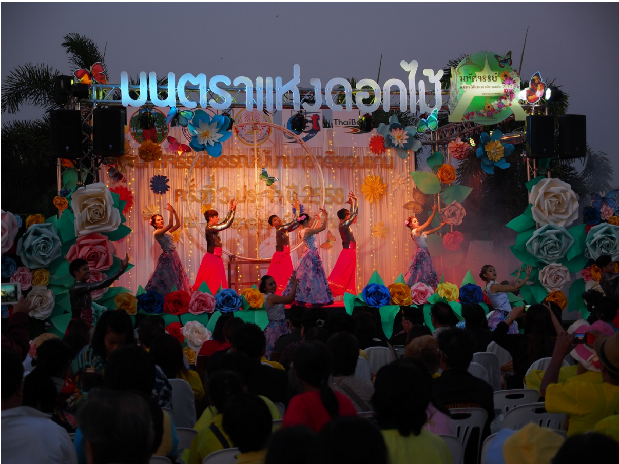
รายงานการประเมิน การจัดงานมหัทศวรรษพรรณไม้นานาชาติประจำปี 2558