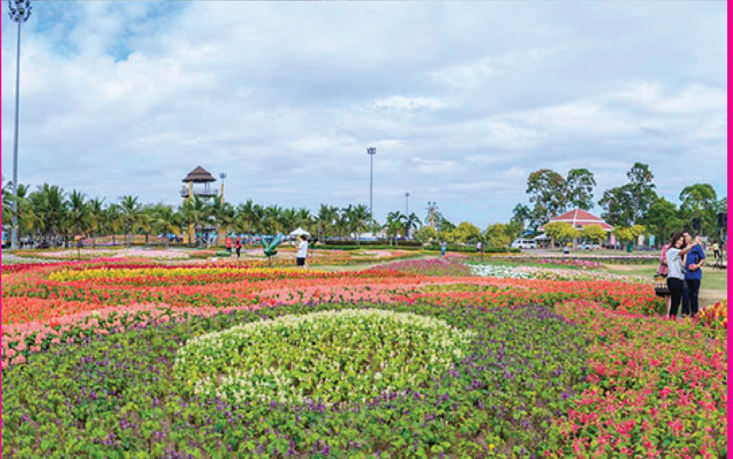
Khon Kaen Amazing International Flower Festival 2015