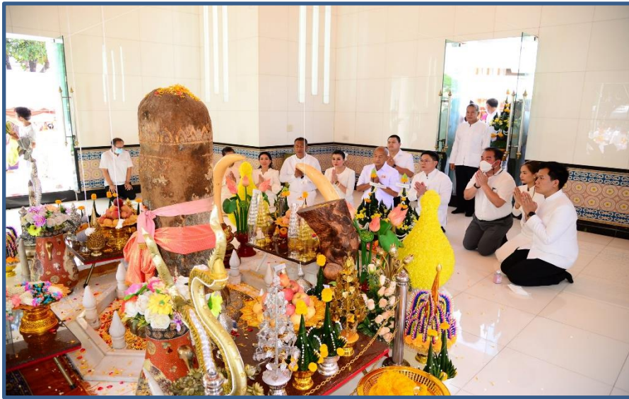
ภาพประกอบที่ 5 การถวายขันหมากเบ็ง (พานบายศรี) คณะผู้บริหาร, ชุมชน, สำนัก/กอง, โรงเรียน 11 โรงเรียน หน่วยงาน และองค์กรต่างๆ