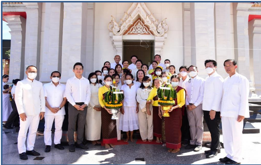
ภาพประกอบที่ 10 การถวายขันหมากเบ็ง (พานบายศรี) ของคณะผู้บริหาร, ชุมชน, สำนัก/กอง, โรงเรียน 11 โรงเรียน หน่วยงาน และองค์กรต่างๆ