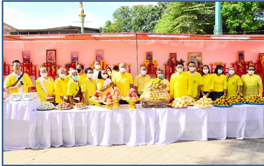
ภาพประกอบที่ 1 พิธีอัญเชิญสิ่งศักดิ์สิทธิ์ 29 แห่ง