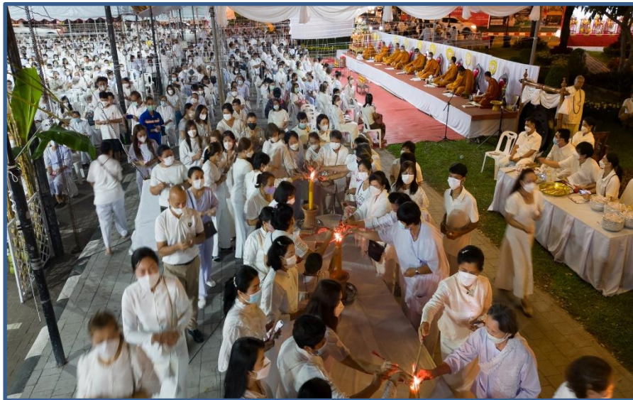
ภาพประกอบที่ 12 พิธีสวนพเคราะห์