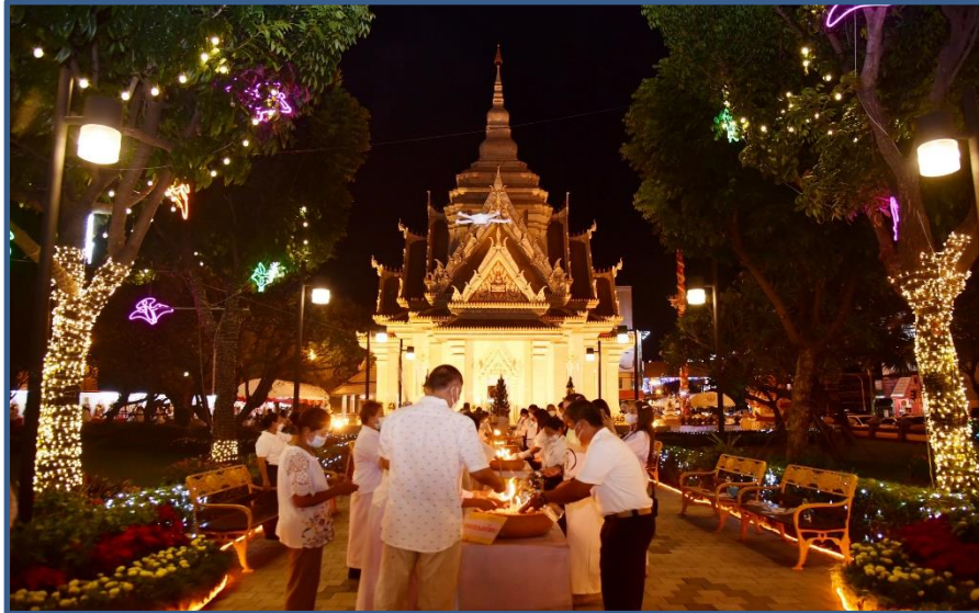
ภาพประกอบที่ 11 พิธีสวนพเคราะห์