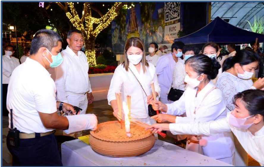
ภาพประกอบที่ 13 พิธีสวนพเคราะห์