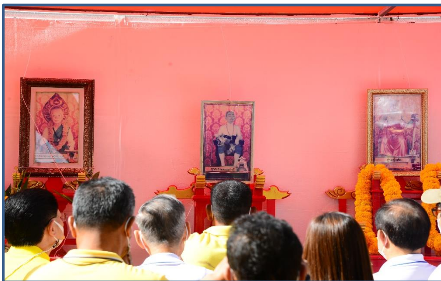
ภาพประกอบที่ 4 พิธีอัญเชิญสิ่งศักดิ์สิทธิ์ 29 แห่ง