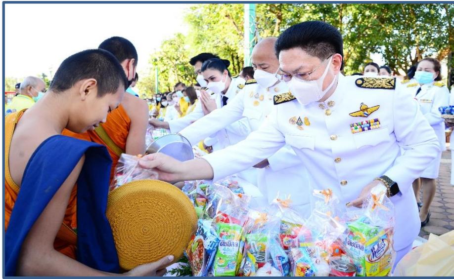
ภาพประกอบที่ 21 พิธีทำบุญตักบาตรวันพ่อแห่งชาติและวันชาติ