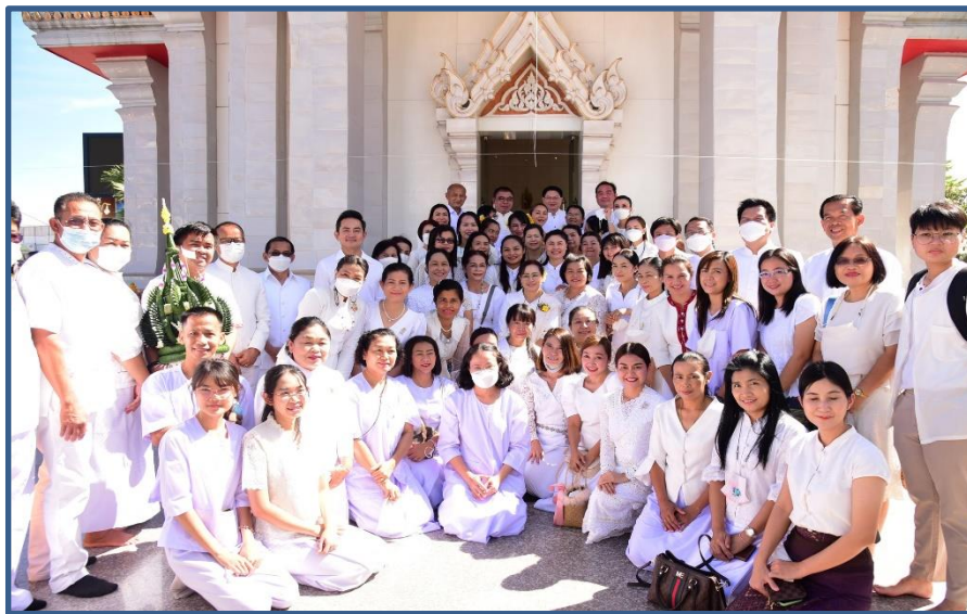
ภาพประกอบที่ 8 การถวายขันหมากเบ็ง (พานบายศรี) ของผู้ว่าราชการจังหวัดขอนแก่น และผู้บริหาร, ชุมชน, สำนัก/กอง, โรงเรียน 11 โรงเรียน หน่วยงาน และองค์กรต่างๆ