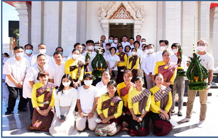
ภาพประกอบที่ 9 การถวายขันหมากเบ็ง (พานบายศรี) ของผู้ว่าราชการจังหวัดขอนแก่น และผู้บริหาร, ชุมชน, สำนัก/กอง, โรงเรียน 11 โรงเรียน หน่วยงาน และองค์กรต่างๆ