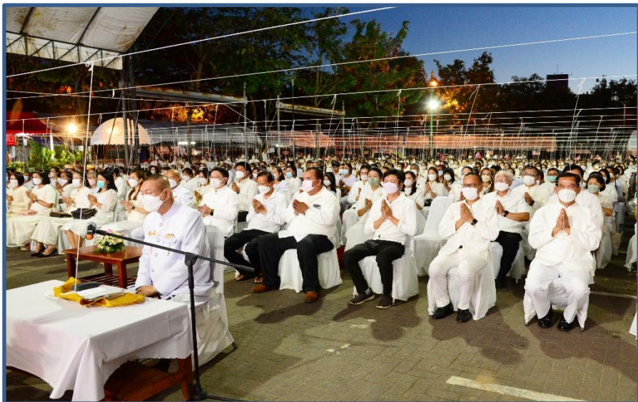
ภาพประกอบที่ 16 พิธีสวดมนต์เมือง และอธิษฐานจิต