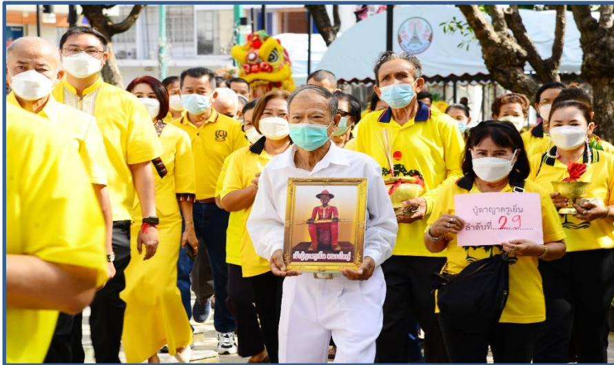
ภาพประกอบที่ 3 พิธีอัญเชิญสิ่งศักดิ์สิทธิ์ 29 แห่ง