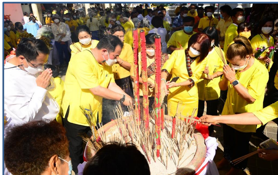
ภาพประกอบที่ 2 พิธีอัญเชิญสิ่งศักดิ์สิทธิ์ 29 แห่ง