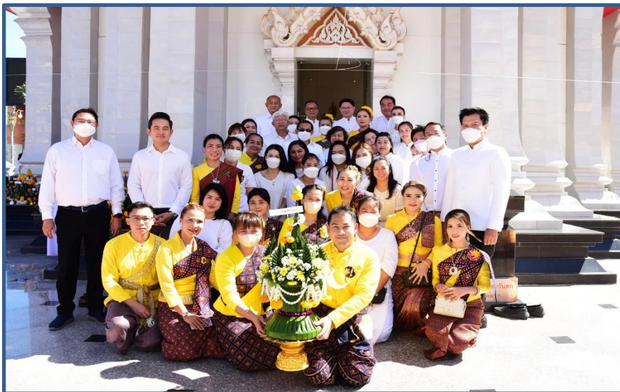
ภาพประกอบที่ 6 การถวายขันหมากเบ็ง (พานบายศรี) คณะผู้บริหาร, ชุมชน, สำนัก/กอง, โรงเรียน 11 โรงเรียน หน่วยงานและองค์กรต่างๆ