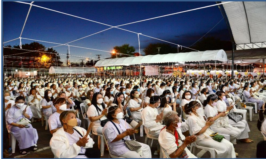
ภาพประกอบที่ 17 พิธีสวดมนต์เมือง และอธิษฐานจิต