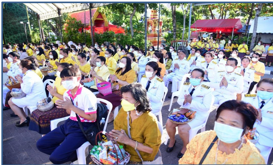
ภาพประกอบที่ 22 พิธีทำบุญตักบาตรวันพ่อแห่งชาติและวันชาติ