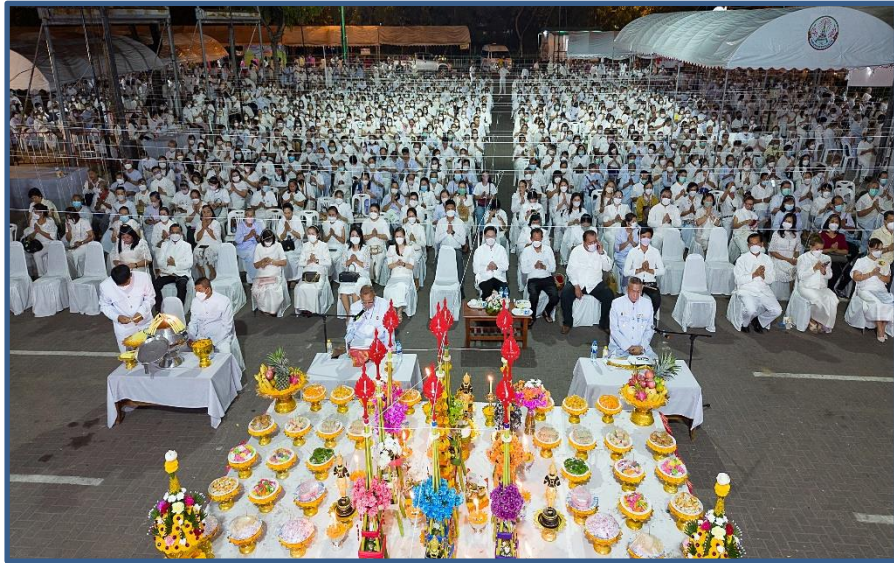
ภาพประกอบที่ 15 พิธีสวดมนต์เมือง และอธิษฐานจิต