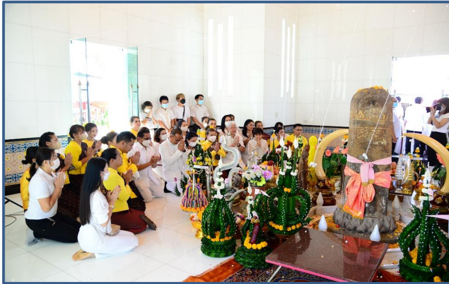
ภาพประกอบที่ 7 การถวายขันหมากเบ็ง (พานบายศรี) คณะผู้บริหาร, ชุมชน, สำนัก/กอง, โรงเรียน 11 โรงเรียน หน่วยงาน และองค์กรต่างๆ