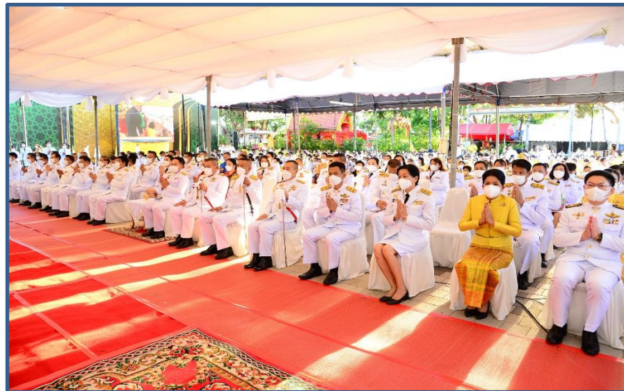
ภาพประกอบที่ 20 พิธีทำบุญตักบาตรวันพ่อแห่งชาติและวันชาติ