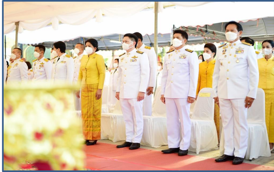
ภาพประกอบที่ 19 พิธีทำบุญตักบาตรวันพ่อแห่งชาติและวันชาติ