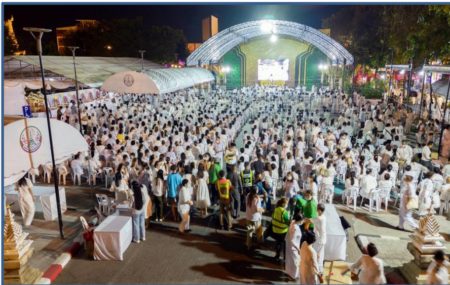
ภาพประกอบที่ 14 พิธีสวนพเคราะห์