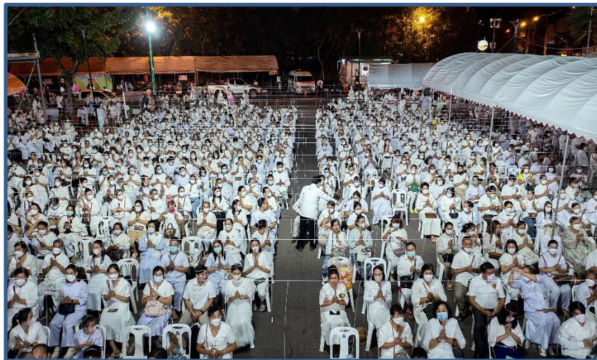
ภาพประกอบที่ 18 พิธีสวดมนต์เมือง และอธิษฐานจิต